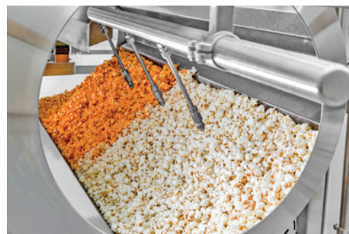
带有自调节式提升喷嘴的远程喷嘴式喷杆。在裹涂机滚筒内使用时可实现精确的定向喷涂。