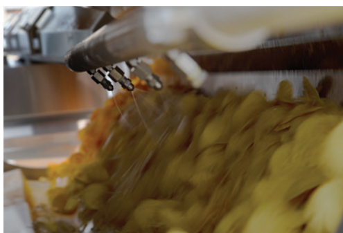
采用无气喷洒，避免喷洒过量，确保喷油速度准确无误。