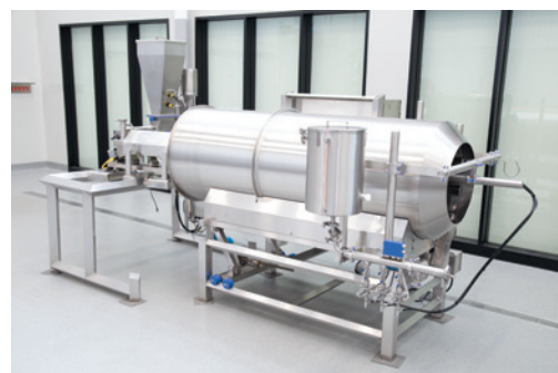
MS-I脉冲油雾喷洒器是两阶段裹涂系统的一部分。