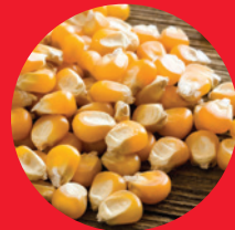
Maíz seco y limpio

El Masa Maker es el primer sistema en el mundo en crear masa fresca, de alta calidad en una fracción del tiempo en comparación con los sistemas tradicionales. De maíz seco a masa fresca en minutos, no horas, el Masa Maker aplica una tecnología pendiente de patente para hacer una variedad de masas de maíz que no requieren cocción ni remojo.