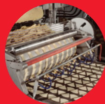
Masa fresca lista para la producción de productos de maíz de calidad.